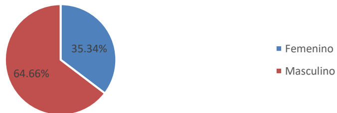
Visitas del Mes por Género